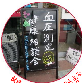
健康のバロメーターでもある血圧を測定してみませんか？