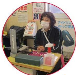
お気軽にご相談ください