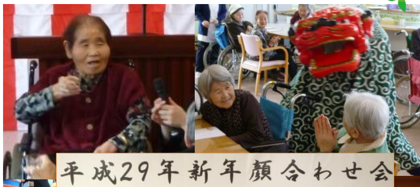
平成29年新年顔合わせ会

11日には富岳 1000 人展へ作品鑑賞に外出させていただきました。ご自身の陶芸や絵画出展作品の展示や、他施設の 0 歳から 104 歳までの絵画や造形、習字や創作物の作品を鑑賞され、「額に入れて飾ると自分の作品じゃないと思うくらい見栄えが良くなった」や「こんな大規模な展示会に出展されるならもっと上手に描けば良かったなあ」と今後の作品制作へ意欲を高められていらっしゃいました。